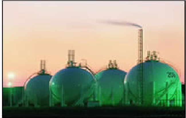
Du transport au stockage

CS2-AF est un extincteur CO2 avec un diffuseur, adapté pour l'usage général. Certifié selon la directive équipements sous pression PED 97/23/EC et la Directive Européenne pour la Marine MED 96/98/EC et NF-EN3. Capacité 2 kg.