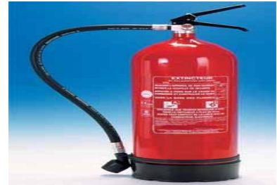
EXTINCTEUR A EAU AVEC ADDITIF : FS9-EV est un extincteur pressurisé à eau additivée avec corps en aluminium et manomètre

Attention Danger : VOUS DÉTENEZ CE TYPE D'ÉQUIPEMENT Vous êtes RESPONSABLE du maintien du niveau de sécurité de l'équipement.