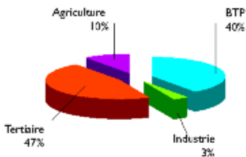
Répartition des accidents du travail mortels par secteurs d'activité en 2010 en PACA

De 2005 à 2008, la majorité des accidents mortels se produisait dans le secteur du BTP. En revanche, en 2009 et 2010, le plus grand nombre des accidents mortels se produit dans le secteur tertiaire.