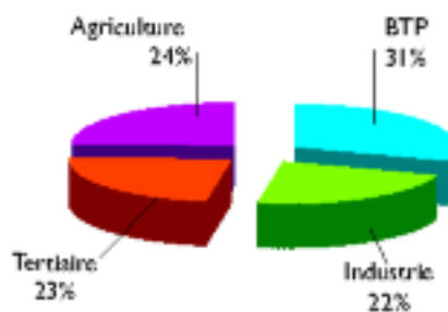
Répartition des accidents du travail graves par secteurs d'activité en 2010 en PACA

Les accidents graves , se produisent en plus grand nombre dans le secteur du BTP (31 %). C'est le même constat depuis 2005.